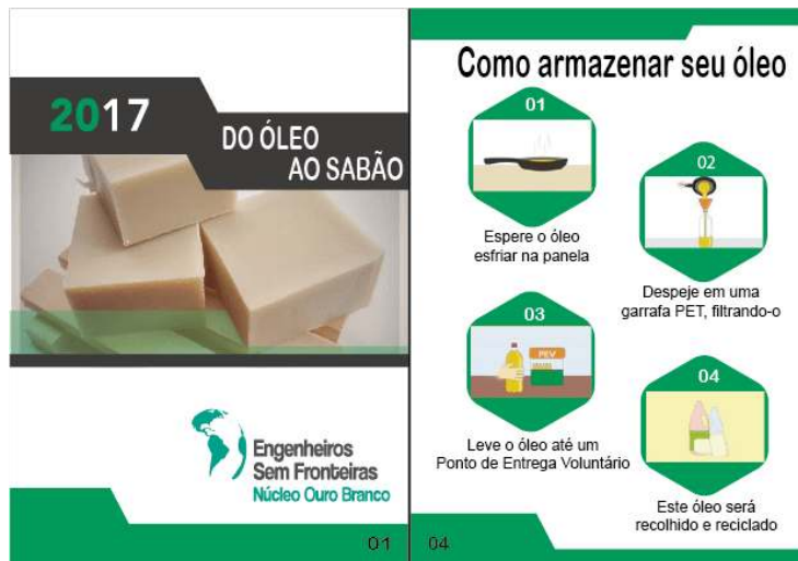
Figura 5 - Parte de fora da cartilha sobre o projeto "Do óleo para o sabão".