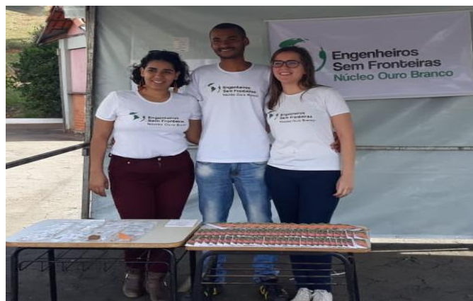
Figura 4 - Membros do núcleo em evento da prefeitura distribuindo cartilhas de conscientização sobre os riscos do descarte inadequado do óleo e também sobre o Projeto Crotalária.