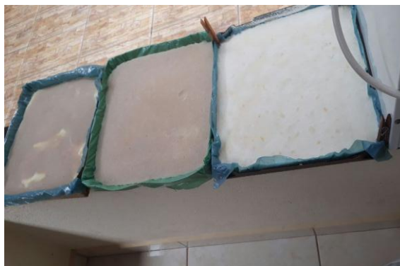
Figura 1 - Sabão fabricado pelos membros do núcleo em processo de secagem.