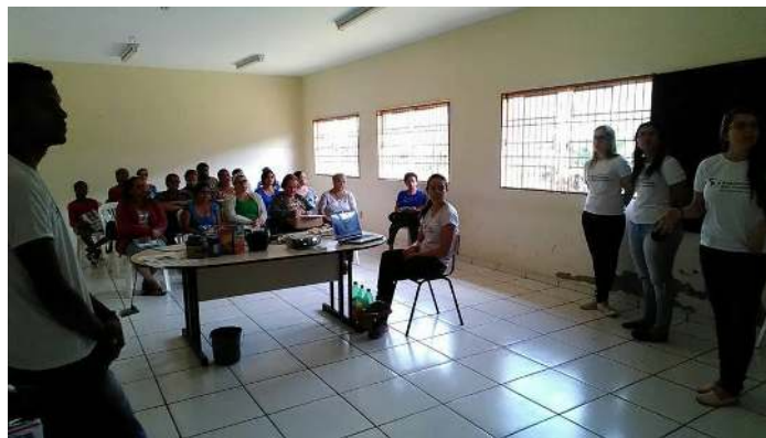
Figura 3 - Palestra e minicurso de fabricação de sabão no CRAS - Ouro Branco.