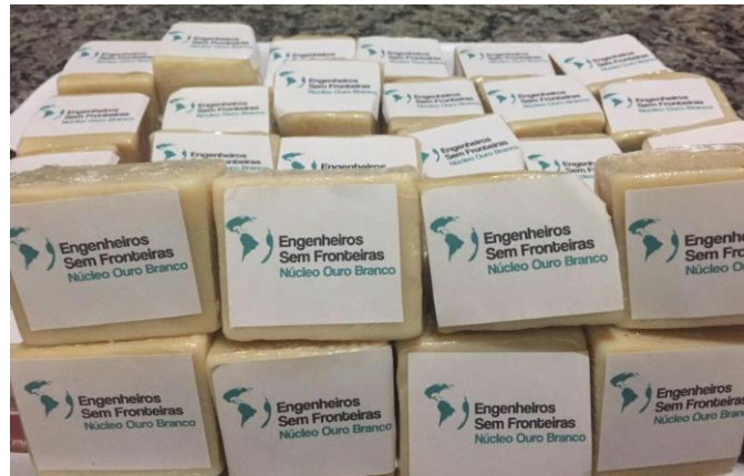
Figura 2 - Sabão fabricado pelos membros do núcleo.